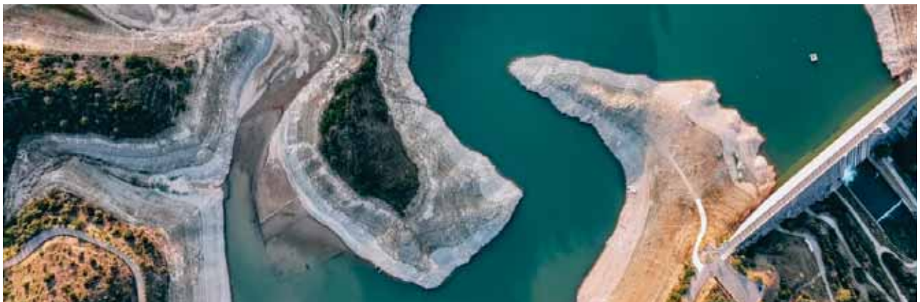
Pantà de Siurana Font: @lasequedel22

Establir un pla a llarg termini que prevegi la creació d'una xarxa d'aigües pluvials diferenciada de la xarxa de clavegueram.